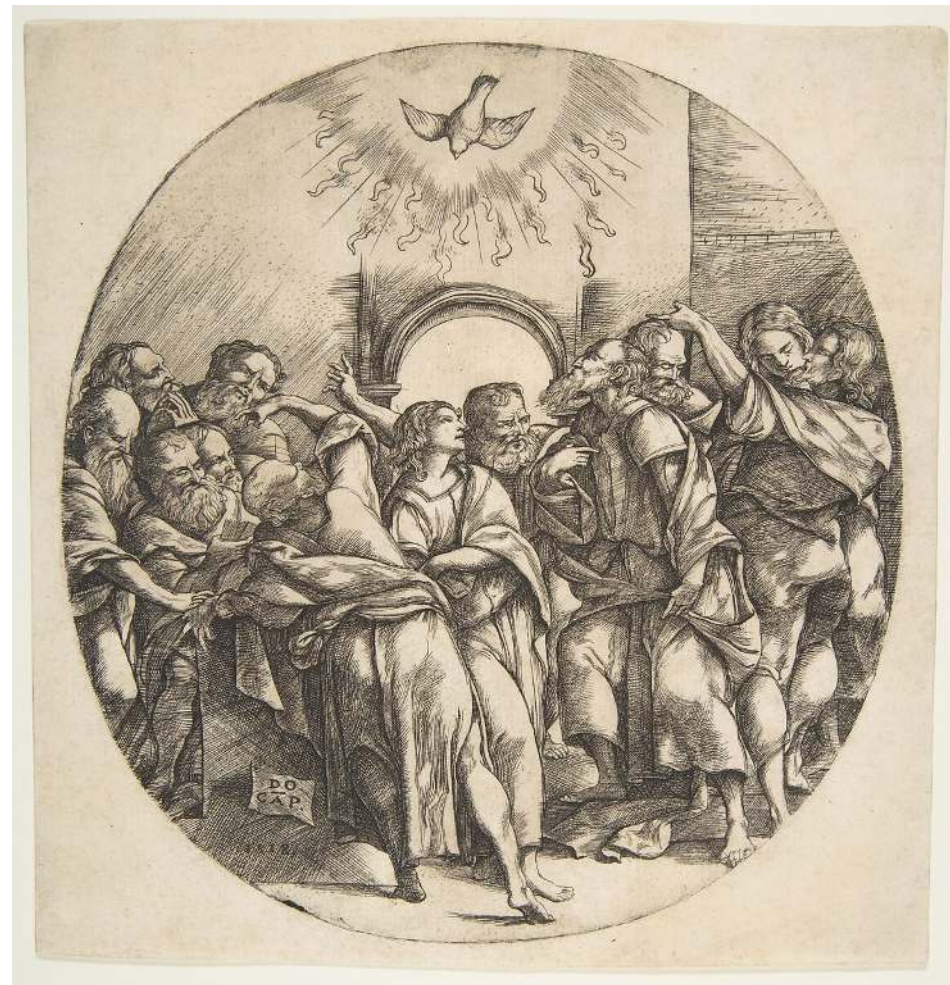
Domenico Campagnola, Seslání Ducha svatého, Itálie