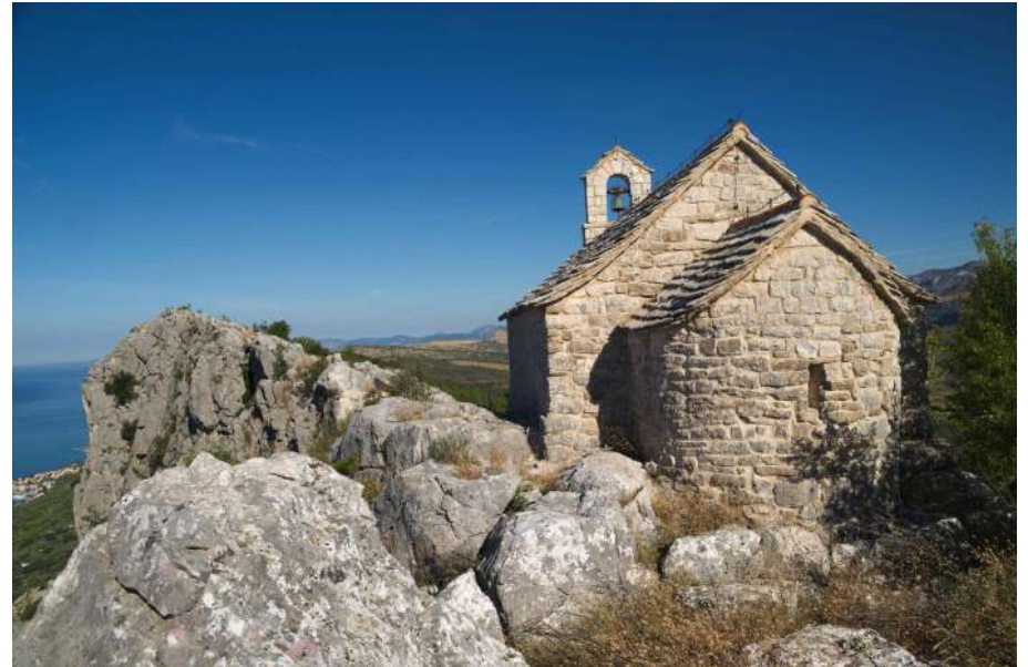
Kostel sv. Maxima, Dalmacie, první zmínka 1080, později přestavován

Odesílatel: Farní sbor ČCE Bratrská 129/IV Jindřichův Hradec 377 01