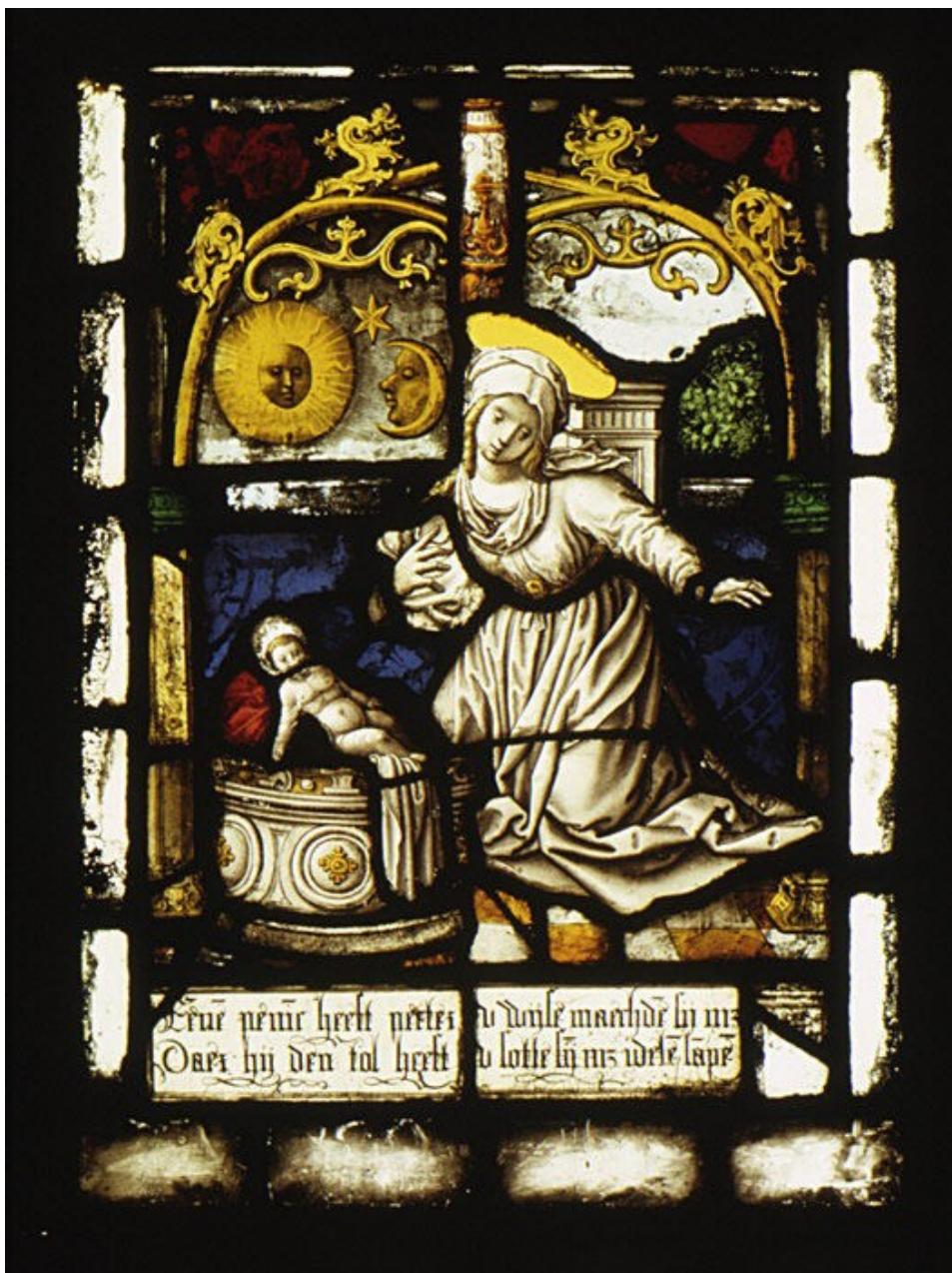
Život Kristův, malba na skle, Lovaň, Belgie, 1525-1530